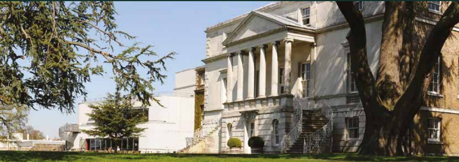
Picture of Whitelands College