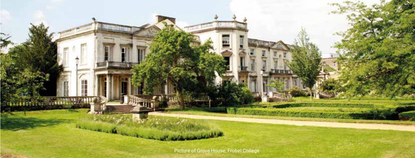
Picture of Grove House, Frobel College